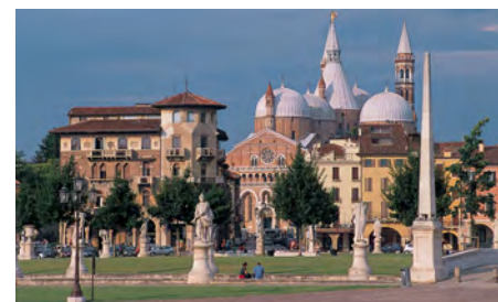
Basilique St Antoine de Padoue

Pour les non-golfeurs : Piscine et centre de fitness sont à disposition au golf ou possibilité d'organiser une visite culturelle de Padoue à 15 min du golf (Basilique St Antoine, chapelle Scrovegni, Prato della Valle, le Dôme de Padoue et shopping). Padoue est connue pour sa beauté, le charme de son architecture, ses canaux et ponts magnifiques, ainsi que sa vibrante culture locale.