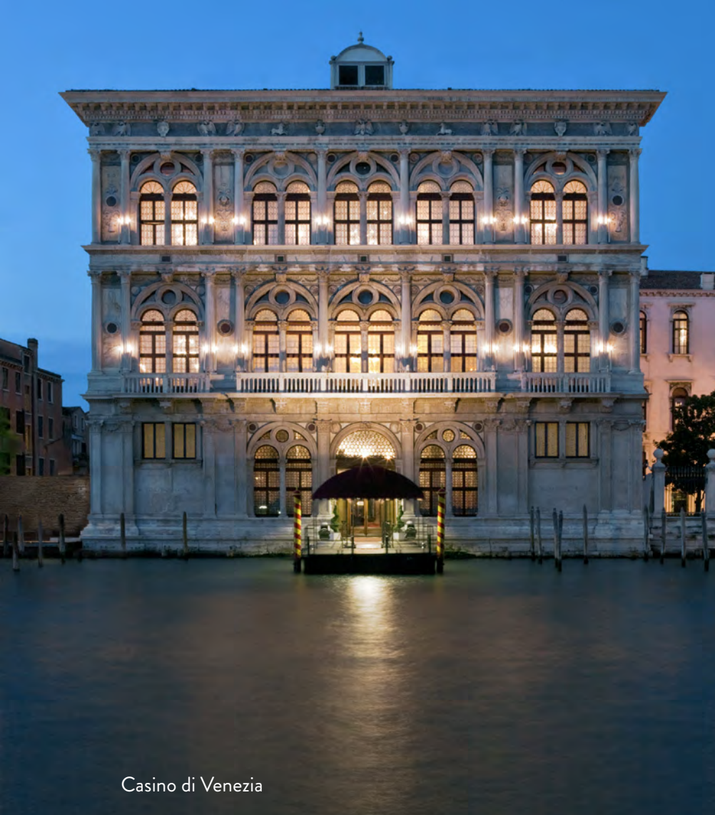
Casino di Venezia